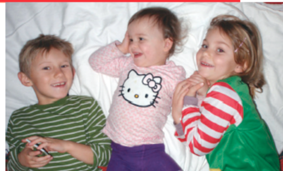
eine sozialpädagogische Ausbildung für das Berufsfeld der schul- und familienergänzenden Betreuung, Bildung und Erziehung