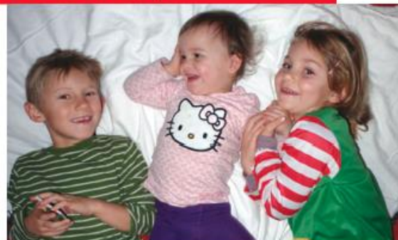
eine sozialpädagogische Ausbildung für das Berufsfeld der schul- und familienergänzenden Betreuung, Bildung und Erziehung