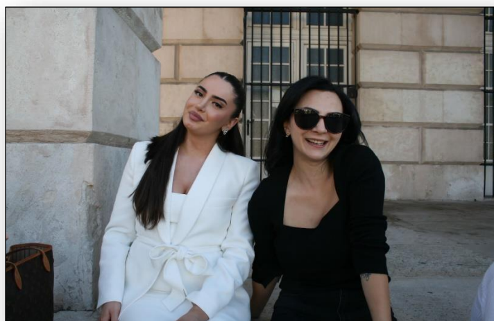
Meine IDPA Partnerin und ich