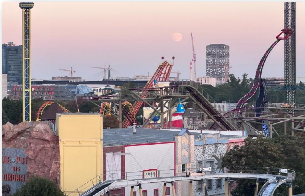
Prater, Wien vom Riesenrad