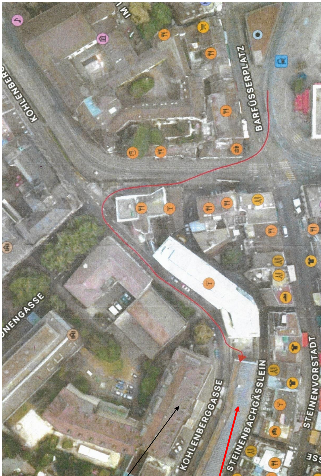
BFS Basel Gebäude A / BFS Basel Gebäude B